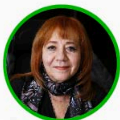
Mtra. María del Rosario Piedra Ibarra Presidenta de la CNDH